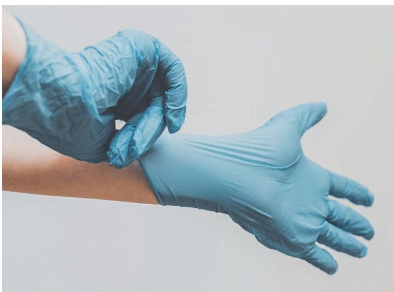
Ärztinnen: Im Beruf engagiert, aber zu selten befördert.